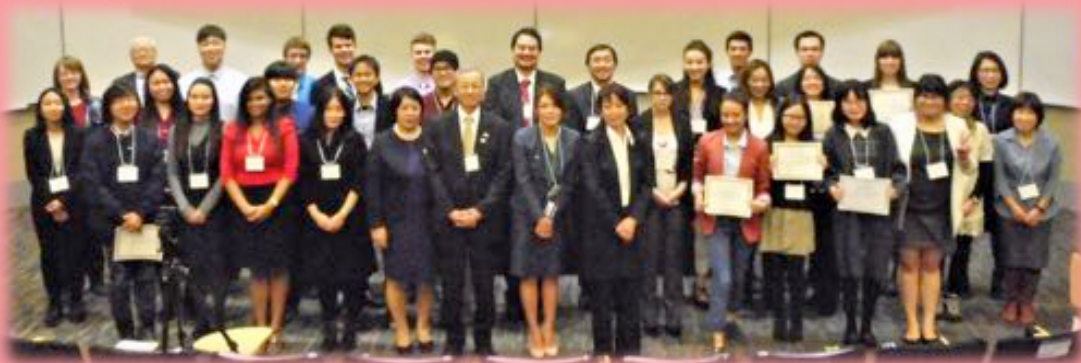
Judges and Participants at the 29 th Canada National Japanese Speech Contest

As of October 31, 2018, the book value of the endowment was $1,712,525.85 and the market value was $2,337,155.44. The amount of the spending allocation of the fund has increased to $79,896.26 this year with an opening balance of $190,210.70.