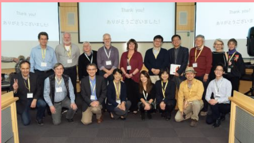
Japan Studies Association of Canada 31 st Annual Conference Members