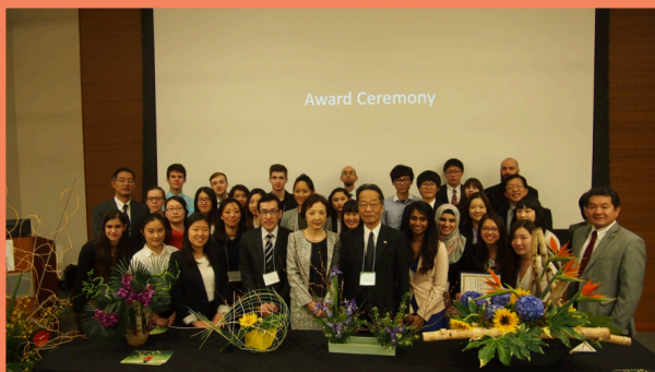
PARTICIPANTS AT THE 26 TH CANADA NATIONAL JAPANESE SPEECH CONTEST

As of March 31, 2015, the book value of the endowment was $1,709,957.21 and the market value was $2,080,709.25. The amount of the spending allocation of the fund was $57,398.40 with an opening balance of $105,765.35. Of this amount, $65,000 has been budgeted for spending in 2015-16.