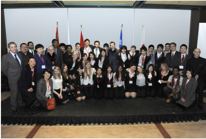
PARTICIPANTS AT THE SIXTH JACAC STUDENT FORUM